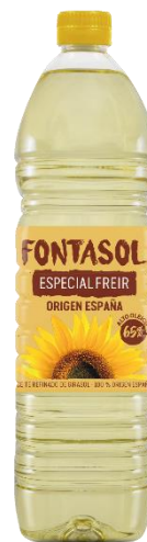
+ ESPECIAL FREIR