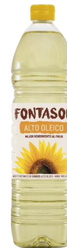
+ ALTO OLEICO

Estas referencias están disponibles en 1L, 3L y 5L, y podemos envasar en otros formatos para adecuarnos a las necesidades de los clientes y a las preferencias del mercado.